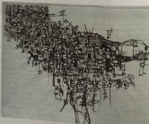
TABLEAU Fine Arts Magazine