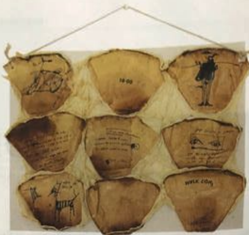
Sopho Tabatadz, 'Coffee filter diaries', koffie, koffiefilters, latex en inkt op Japans papier, 33 x 45 cm