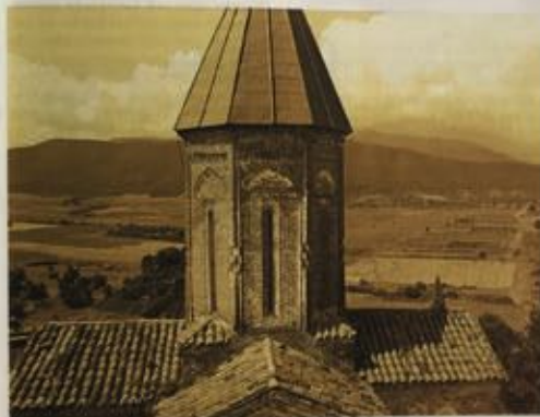
Max de Bruijn

Georgië is een soort Nederland aan de Zwarte Zee: klein en eigenwijs. Met dien verstande dat het land al een cultuurcentrum was toen de moerasbewoners in de Rijndelta nog nauwelijks in staat waren hun eigen hutten te bouwen. Het landschap lijkt eropzins op Noord-Italië: zee, bergen, oude steden en wijngaarden. De mannen praten op ruzieschillige toon. De vrouwen zwijgen, maar zijn daadkrachtig (Medea komt er vandaan). Cultuur wordt met de paplepel ingegoten: voetballers kunnen de beroemde nationale dichters reciteren. Kunst staat in zeer hoog aanzien. Ook onder de Russen - Georgië was tot 1992 een Sovjet-Republiek - behield het land zijn eigen cultuur en ontscheidde de Georgische kunst zich los van de voorgeschieden oede. Kort na de burgeroorlog van 1992-1993 openden alweer de eerste nieuwe galerijen. Georgiërs